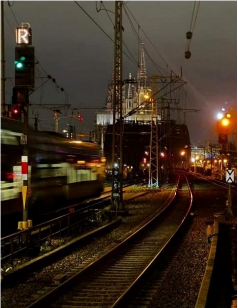
Hohenzollernbrücke gezien vanaf Köln-Deutz